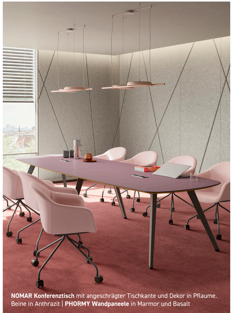
NOMAR Konferenztisch mit angeschrägter Tischkante und Dekor in Pflaume. Beine in Anthrazit | PHORMY Wandpaneele in Marmor und Basalt

PALMBERG bietet ein vielfältiges und durchdachtes Angebot – für jede Büroanforderung.