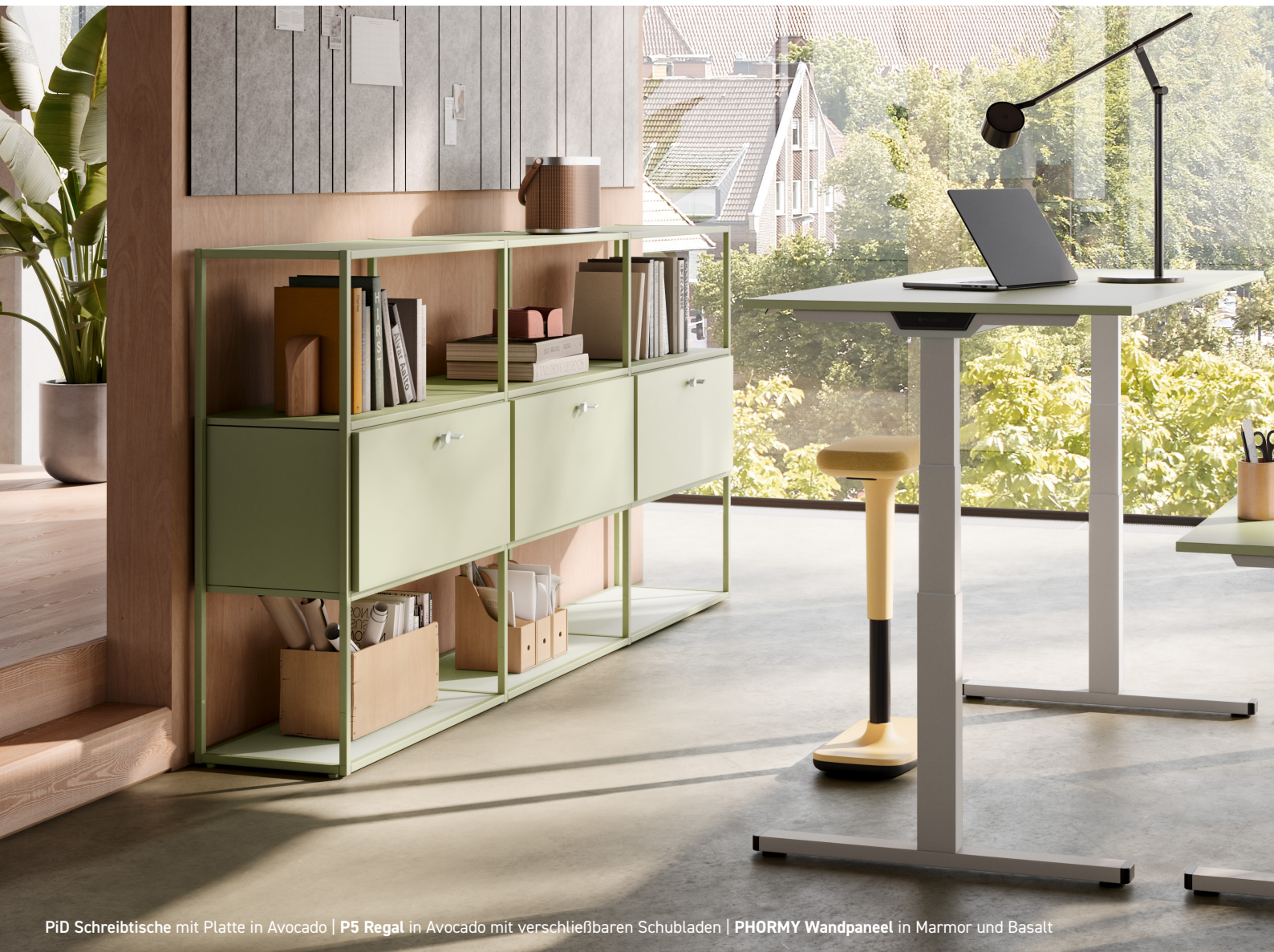
PiD Schreibtische mit Platte in Avocado | P5 Regal in Avocado mit verschließbaren Schubladen | PHORMY Wandpaneel in Marmor und Basalt