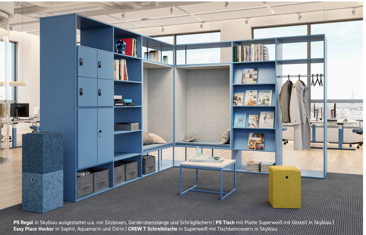
P5 Regal in Skyblau ausgestattet u.a. mit Sitzboxen, Garderobenstange und Schrägfächern | P5 Tisch mit Platte Superweiß mit Gestell in Skyblau | Easy Place Hocker in Saphir, Aquamarin und Citrin | CREW T Schreibtische in Superweiß mit Tischbeincovern in Skyblau

PALMBERG entwickelt ergonomische, flexible und durchdachte Büromöbel, die moderne Arbeitswelten aktiv mitgestalten. Unsere Einrichtungssysteme passen sich den Menschen und ihren Prozessen an – nicht umgekehrt. Mit langjähriger Erfahrung, innovativer Planung und dem Qualitätsversprechen „Made in Germany“ schaffen wir funktionale Arbeitsräume, in denen Effizienz und Wohlbefinden zusammengehören.