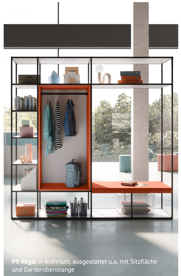
P5 Regal in Anthrazit, ausgestattet u.a. mit Sitzfläche und Garderobenstange