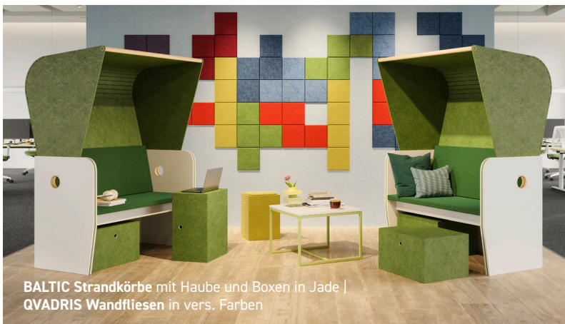
BALTIC Strandkörbe mit Haube und Boxen in Jade | QVADRIS Wandfliesen in vers. Farben