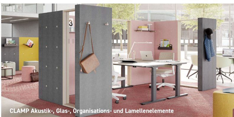
CLAMP Akustik-, Glas-, Organisations- und Lamellenelemente